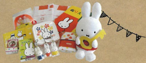
ミッフィーグッズ

※アンケートにご協力いただいた方、両日合わせて1家族又は1グループ1つとなります。 ※写真はイメージです。ご来場の際、本チラシをご持参ください。 ※特典には限りがございます。なくなり次第終了。